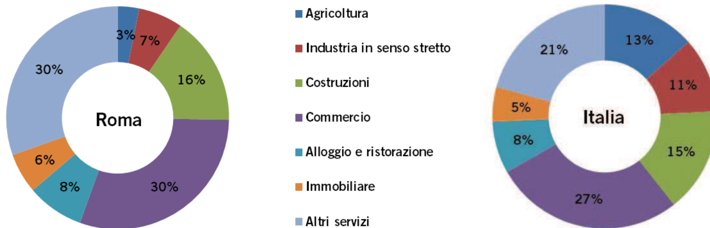
Graf. 3 – Incidenza percentuale delle imprese registrate per attività economica (ATECO 2007 escluse le imprese Non Classificate) al 2° trimestre 2015