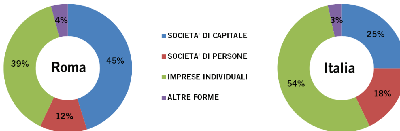
Graf. 2 – Incidenza percentuale delle imprese registrate per forma giuridica al 2° trimestre 2015